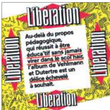
journal Libération, octobre 2023

petits et grands lecteurs, autrices et auteurs, libraires, médiathécaires et toute la foule de pros et de cœur qui font vivre le livre.