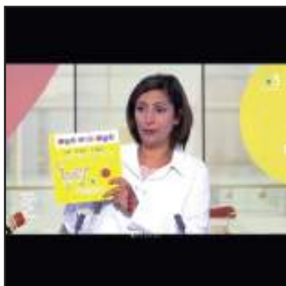
émission Vous êtes formidables, France 3 Pays de la Loire

Petit exercice de style avec ce drôle d'album proposé par la nouvelle maison d'édition Six Citrons acides, engagée pour une langue française vivante.