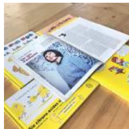
magazine Bretons, mars 2022

À chaque album (le quatrième maintenant) des rires ! Pour la jeune maison Six citrons acides éditions qui a choisi de mettre la langue à l'honneur en dédramatisant à fond ses bizarreries, Mes quatre zamis de @vehlmannfabien et @charles_dutertre sont une nouvelle réussite !